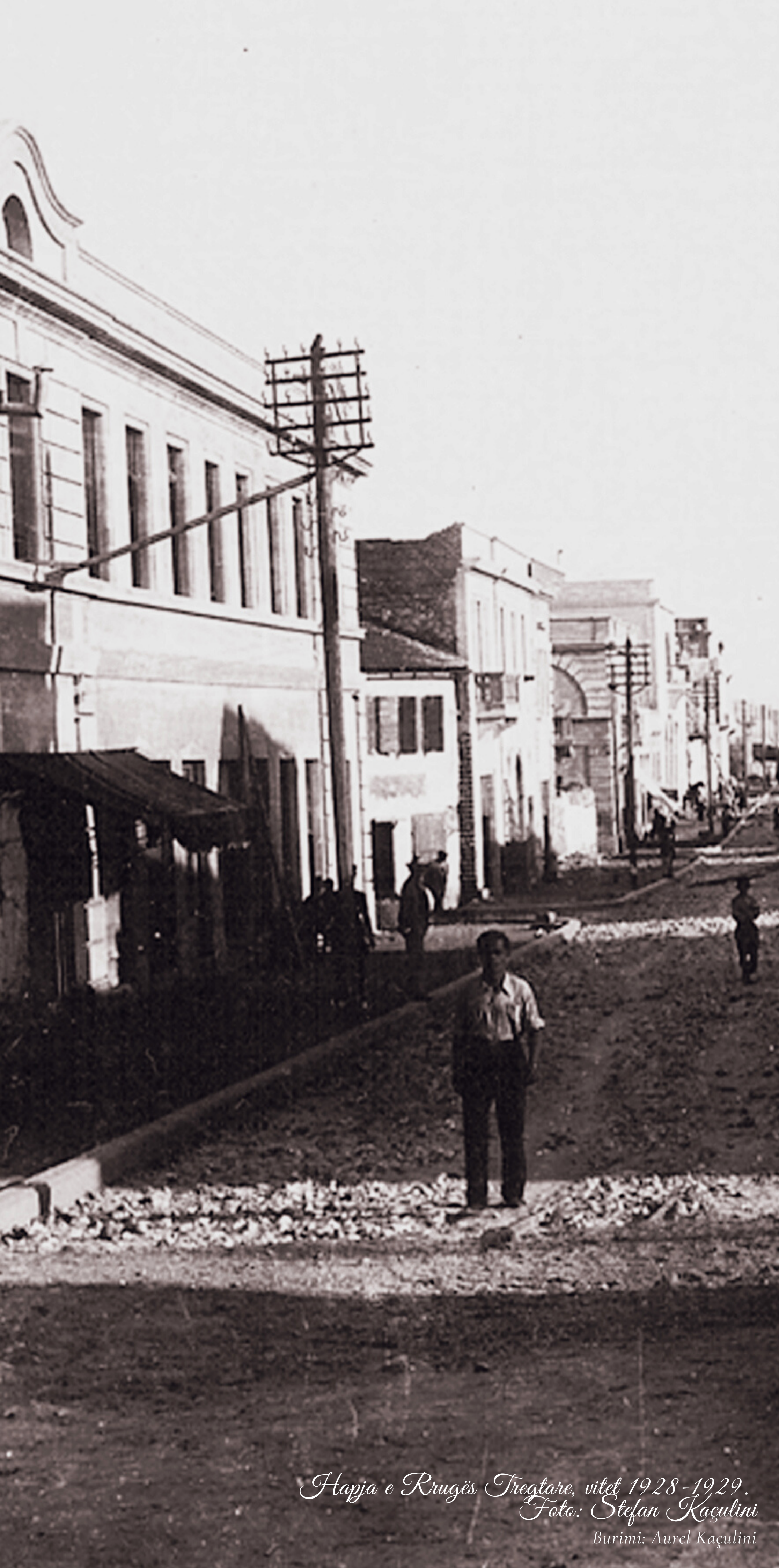
Hapja e Rrugës Treglare, vitet 1928-1929.